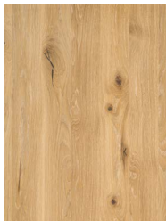
Eiche Wild Weißöl*