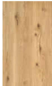
Eiche Wild Weißöl*