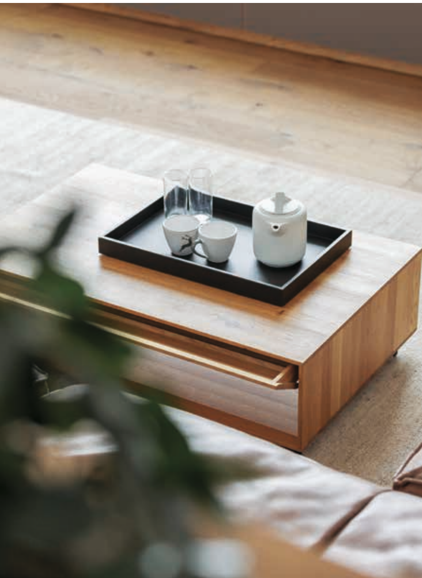
Abb. rechts: Ein speziell für diese gemütliche Fensternische entwor- fenes cubus Lowboard aus Eiche Wild mit schräg zulaufender Deck- platte und darunter eingebauten Schubladen.

fig. below: Our lux coffee table made of matching wild oak with a hidden drawer for storage.