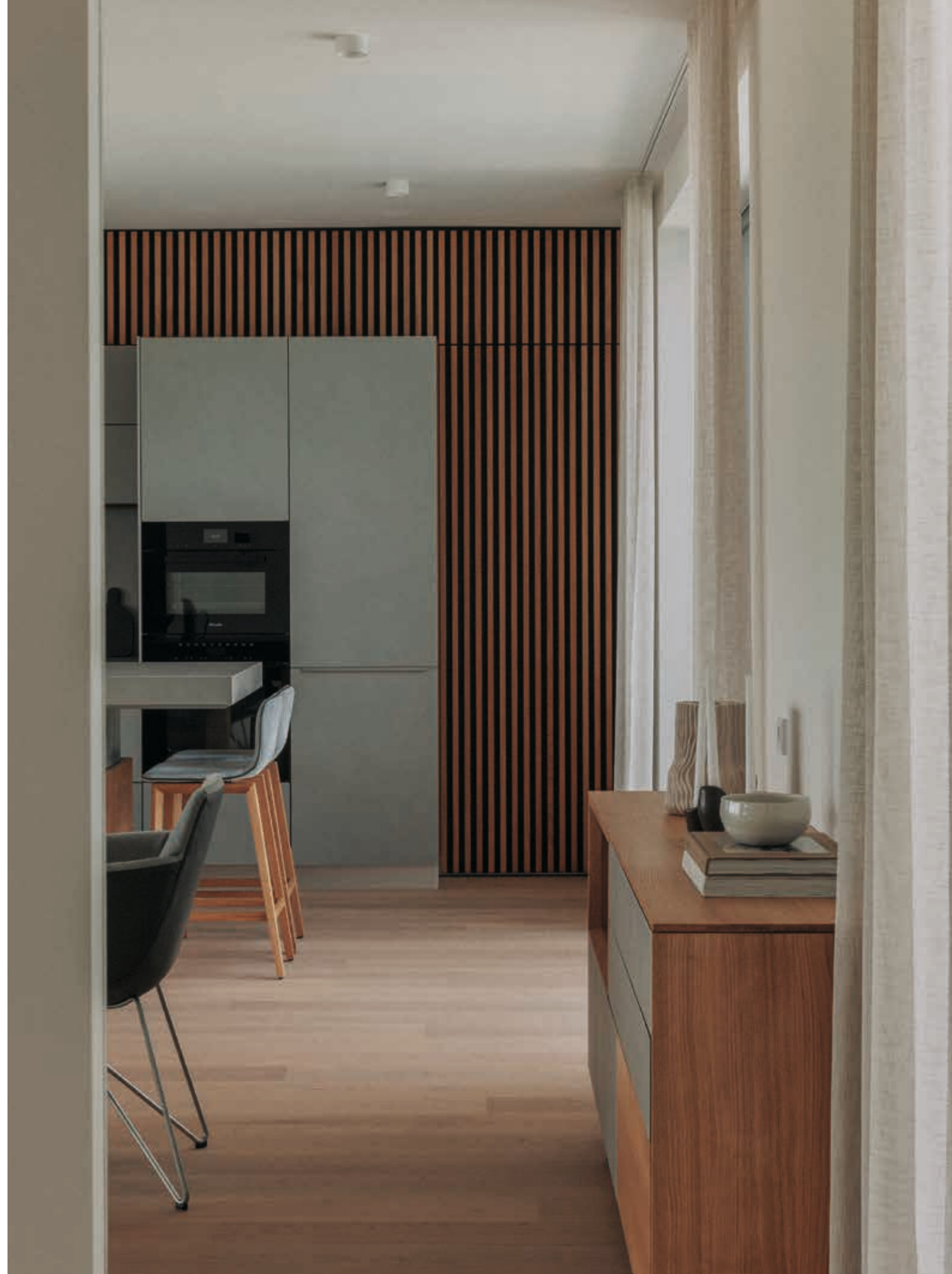
fig. right and next page: A custom-designed k7 kitchen features wall cladding and wooden slats. The kitchen includes ceramic drawers and cupboards in the colour phedra, along with a height-adjustable island.

Abb. rechts und nächste Seite: Eine maßgefertigte k7 Küche mit Wandverkleidung aus Holzlamellen. Die Küche ist mit Keramikschubladen und -schränken in der Farbe phedra sowie einer höhenverstellbaren Kochinsel ausgestattet.