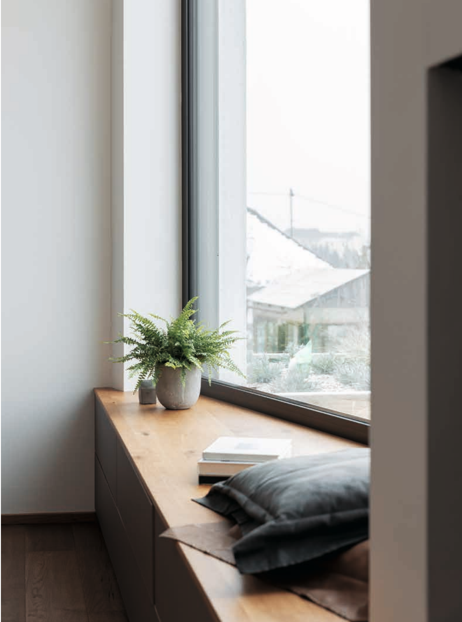
fig. right: A cubus lowboard specially-designed into a cozy window nook, topped with an angled wild oak surface and built-in storage drawers underneath.

Abb. rechts: Ein speziell für diese gemütliche Fensternische entwor- fenes cubus Lowboard aus Eiche Wild mit schräg zulaufender Deck- platte und darunter eingebauten Schubladen.