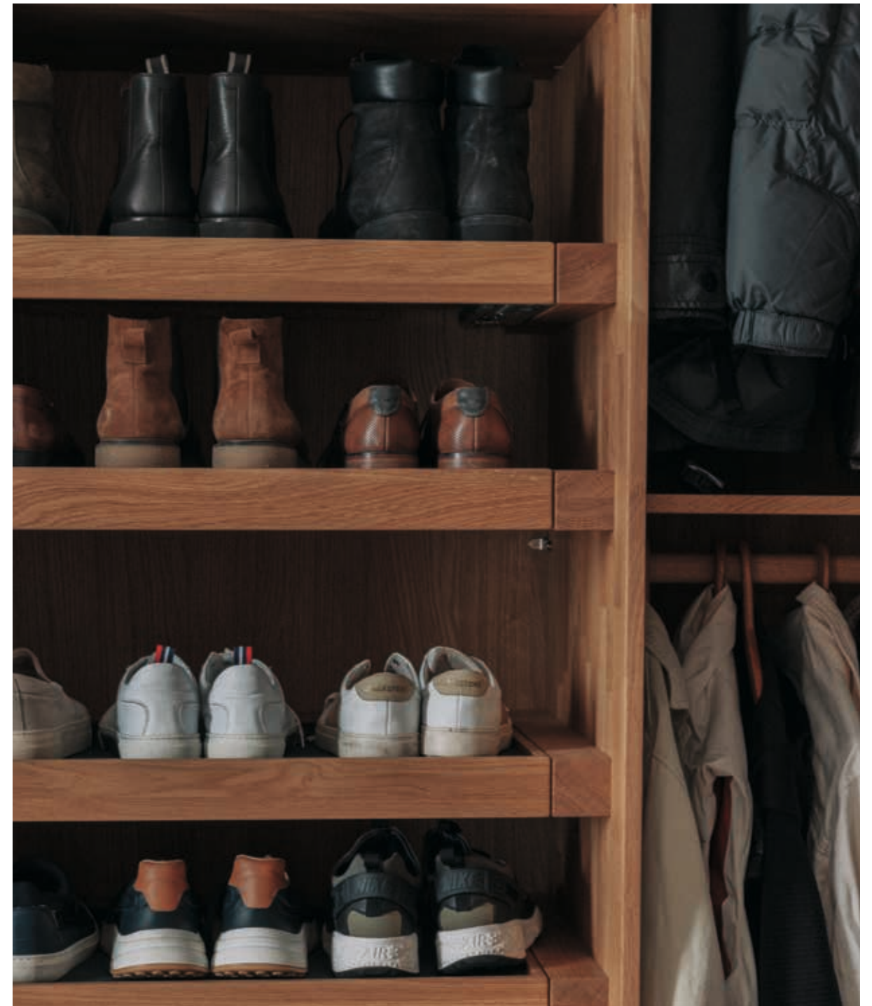
Maßgefertigter Kleiderschrank mit integrierten Schuhschubladen.

Made-to-measure wardrobe with integrated shoe drawers.