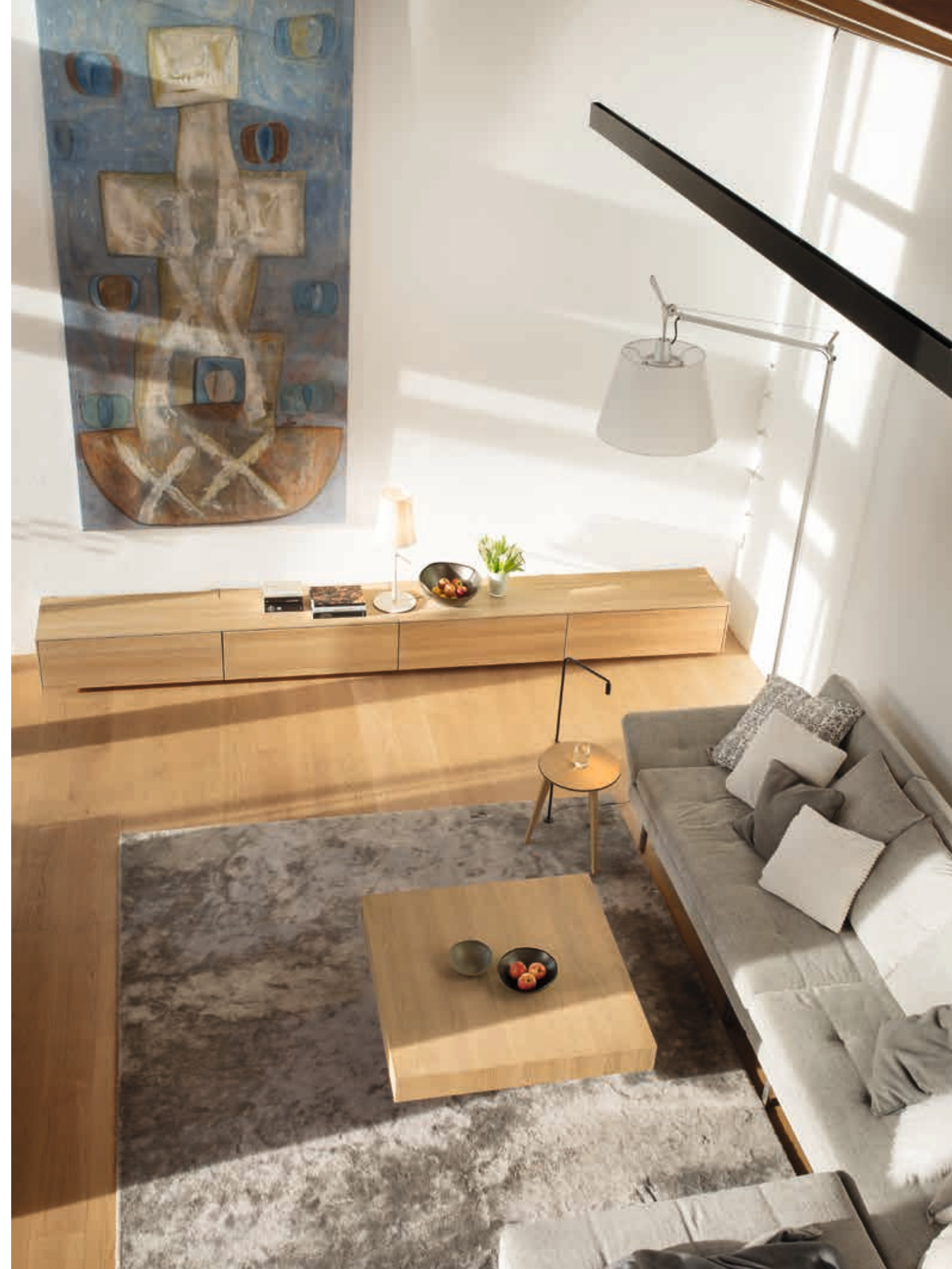
Abb. rechts: Perfekte Harmonie im Wohnzimmer mit unserem filigno Sideboard, dem elektrisch höhenverstellbaren lift Couchtisch und dem hi! Beistelltisch, alles in Eiche Weißöl.

fig. above: A built-in wardrobe with white glass doors, combined with a filigno sideboard and hood clothes rack.