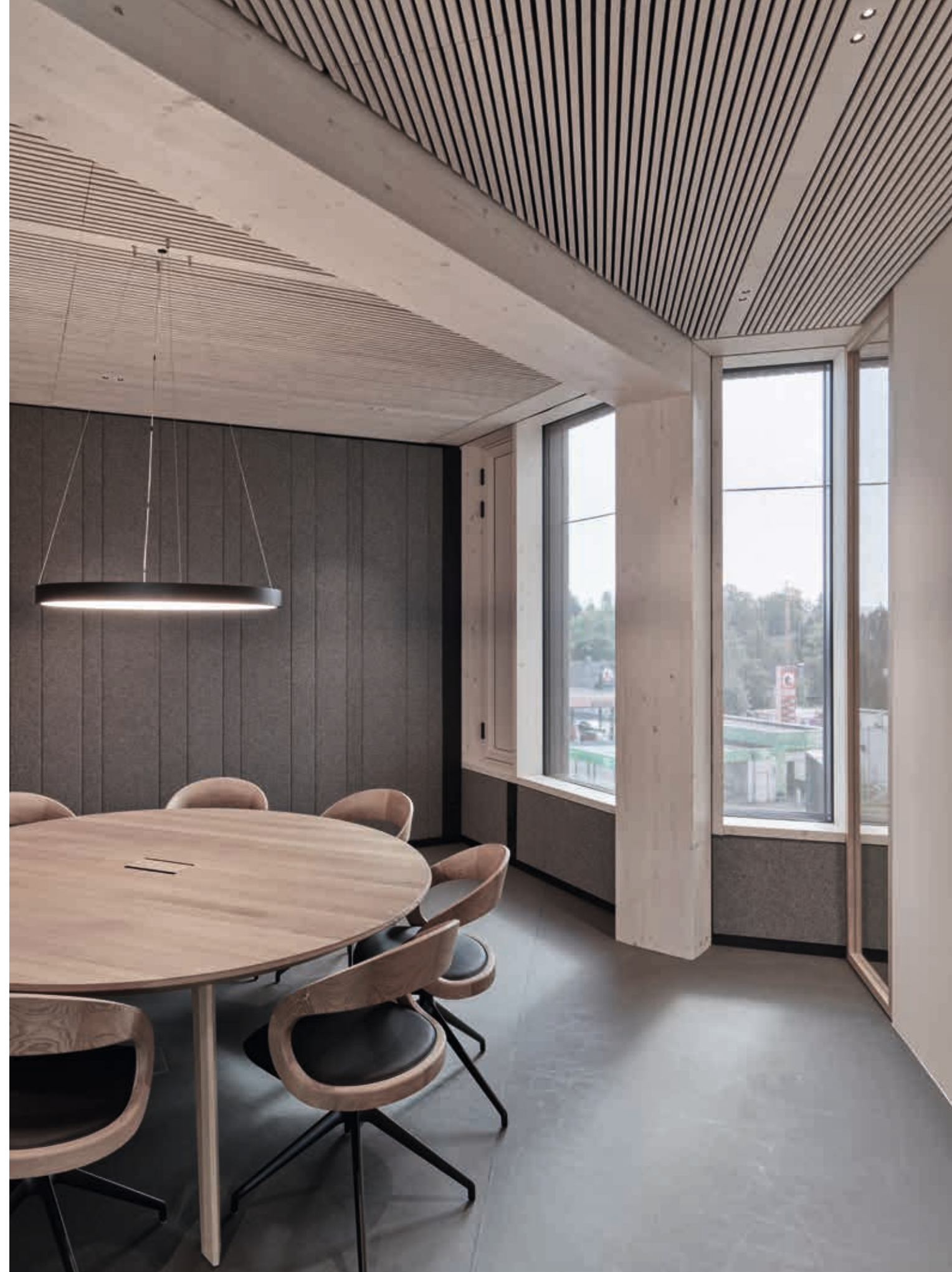
Abb. rechts: miró Tisch in Eiche Weißöl mit speziellem flächenbündigem Kabelauslass, kombiniert mit acht girado Stühlen.

fig. above: Height-adjustable pisa desk in oak white oil with a custom-designed fabric screen that extends to the wall cladding in the room.