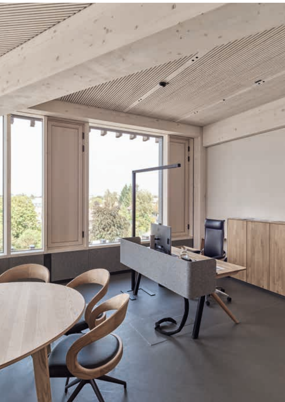
Abb. oben: Höhenverstellbarer pisa Schreibtisch in Eiche Weißöl mit einer maßgefertigten Stoffblende, die sich in der Wandverkleidung des Raumes fortsetzt.

fig. above: Height-adjustable pisa desk in oak white oil with a custom-designed fabric screen that extends to the wall cladding in the room.