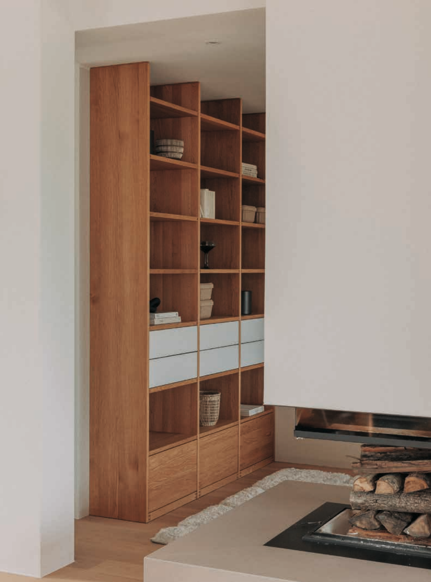
cubus Regalwand aus Eichenholz mit Fachböden und Schubladen im unteren Bereich.

cubus wall-to-wall unit made of oak, featuring built-in shelves with drawers at the bottom.