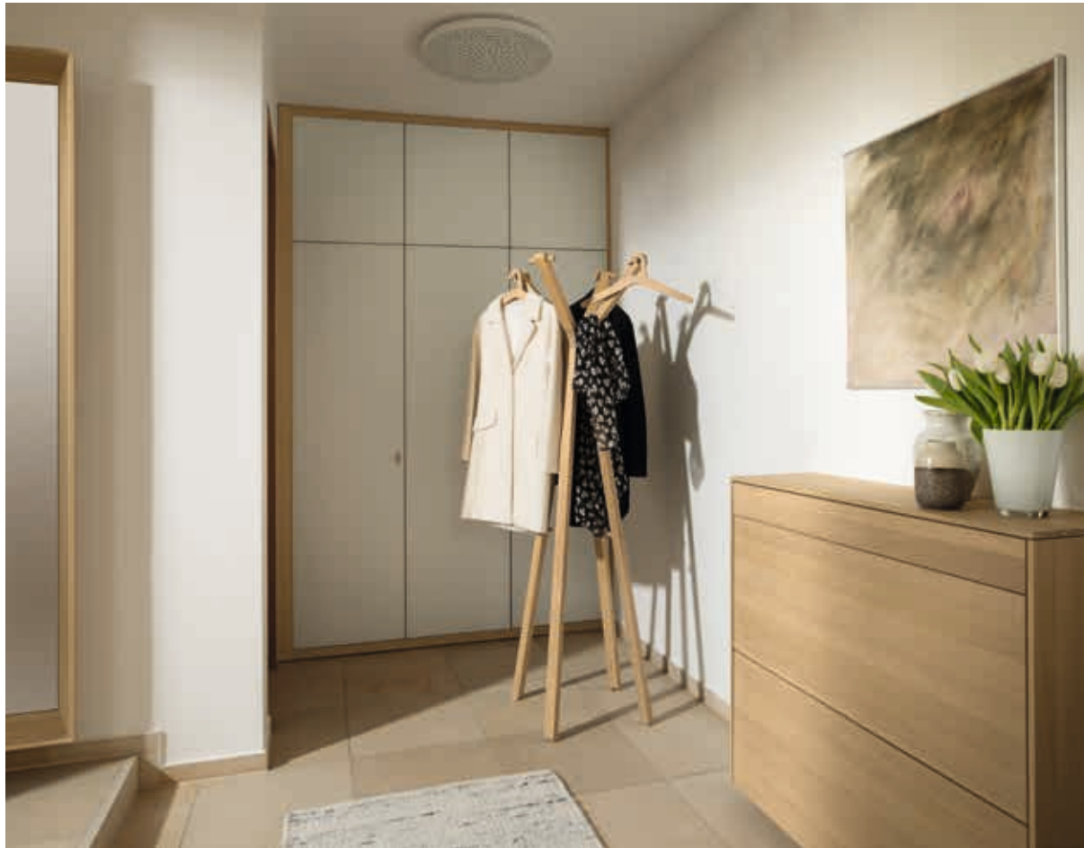
Abb. oben: Ein Einbauschränk mit weißen Glastüren, kombiniert mit einem filigno Sideboard und einem hood Kleiderständer.

fig. above: A built-in wardrobe with white glass doors, combined with a filigno sideboard and hood clothes rack.